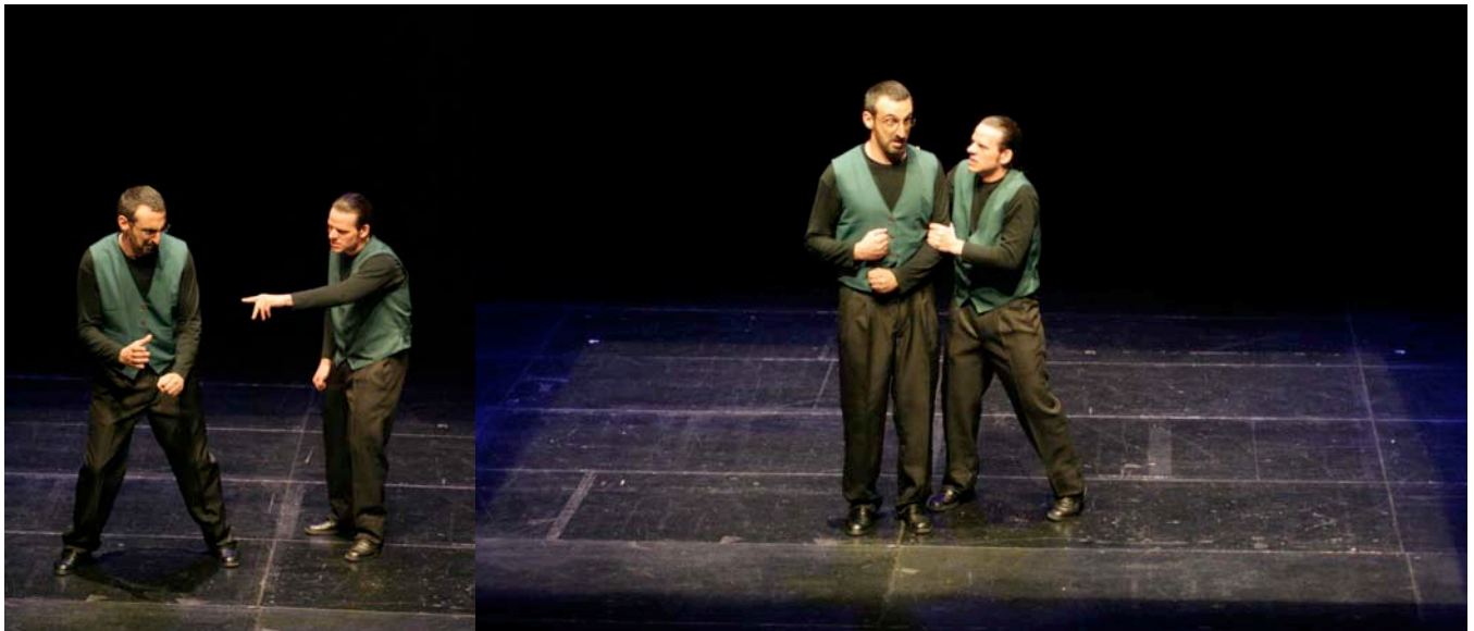
GABRIEL SOLANS RUIZ (TERRASSA 1970)